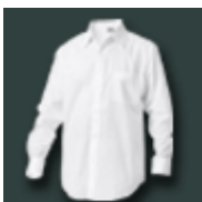
Langärmelige Hemden und Blusen